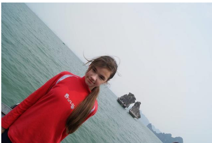
Бухта Халонг и ее символ Петух и Курица

А вот бухта Халонг и в реальной жизни и в фильме ПРЕКРАСНА!